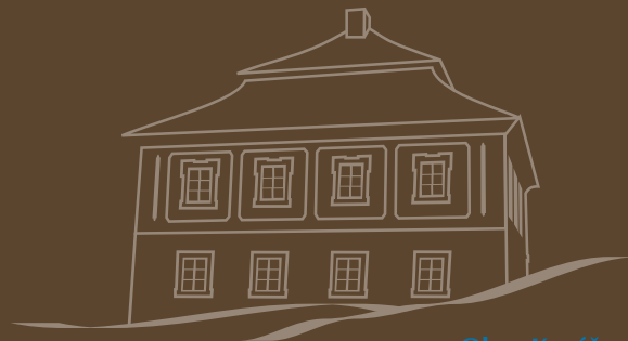
Obec Kovářov – prostory barokní fary

"Für die Volkstraditionen mit den Nachbarn"