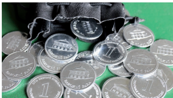
ražba mincí Domu regionů