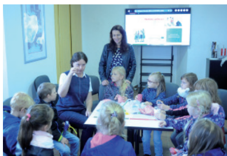
Výchovné pořady pro žáky základní školy.