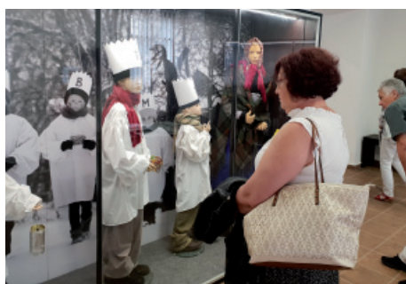
Den otevřených dveří.