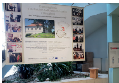
Prezentace Domu regionů, výstava na Krajském úřadě Jihočeského kraje.