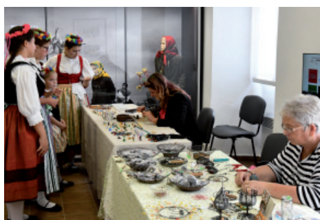
S lidovými řemesly.