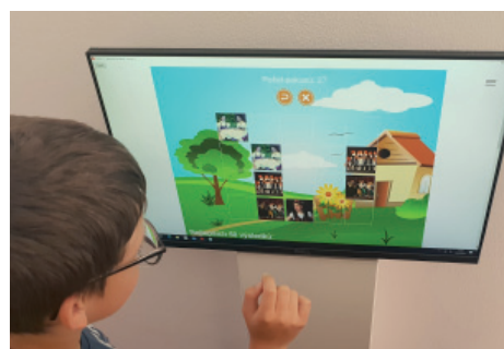
Hry s lidovou tématikou v mobilní aplikaci.

Jihočeské folklorní sdružení je dobrovolnou zájmově-společenskou organizací sdružující dětské i dospělé folklorní soubory a přátele folkloru s posláním přispívat k ochraně, tvůrčímu rozvíjení a popularizaci folkloru a lidové kultury, zejména jižních Čech.