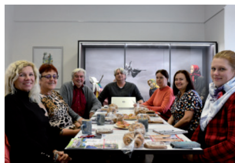
Setkání vedoucích folklorních souborů.