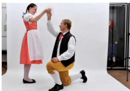
Fotodokumentace lidových krojů.