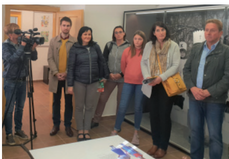
Setkání projektových partnerů.