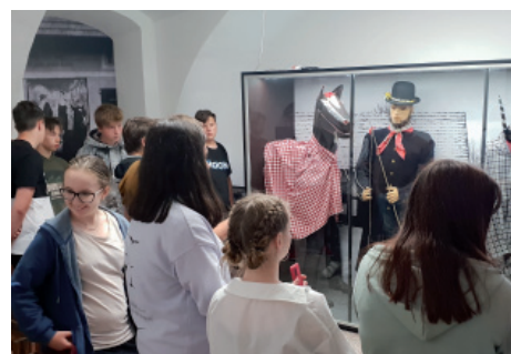
Prohlídka expozic lidových tradic.