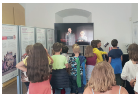
Sledování dokumentů ve video sálu.