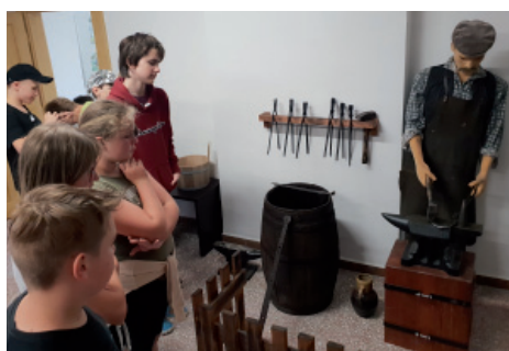
Seznamování s kovářským řemeslem.