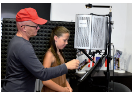
Nahrávání lidových písní.